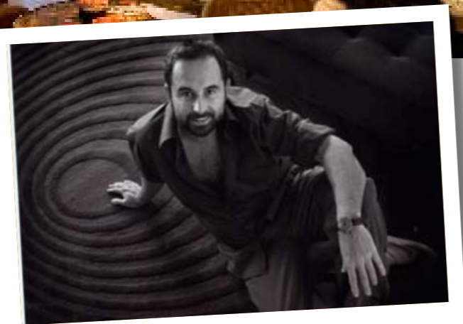
Pepe Leal www.pepeleal.com

Para este estudio se creó un patchwork muy contrastado y de colores vibrantes que da una imagen muy vanguardista al espacio. Otra alternativa propuesta por el interiorista es dibujar directamente sobre la pared.